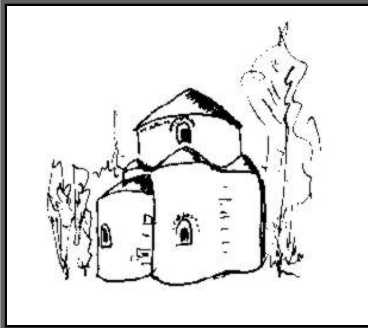
Kraków. Rotunda NMP. Na Wawelu rekonstrukcja.

Rotunda to budowla na planie koła, kryta kopułą. Romańskie kościoły jednak najczęściej budowano na planie krzyża łacińskiego